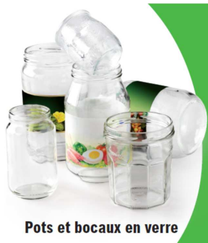
Pots et bocaux en verre