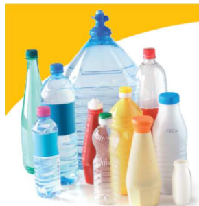
Uniquement bouteilles et flacons en plastique